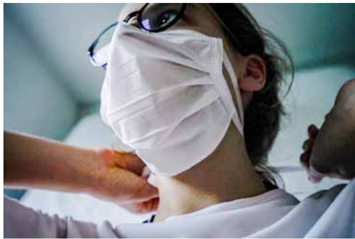
Uso de máscaras é uma realidade mundial desde 2020

"Tira casaco, coloca casaco" é uma expressão do filme Karate Kid, de 2010. Agora, a frase pode ser atualizada para "Tira máscara, coloca máscara", uma vez que vários Estados brasileiros flexibilizaram o uso. Para saber como a população está se sentindo em relação à essa nova fase, a Hibou - empresa especializada em pesquisa e monitoramento de mercado e consumo - realizou o levantamento "Pandemia - Uso da Máscara 2022", em que 1280 pessoas responderam sobre suas expectativas e comportamentos.