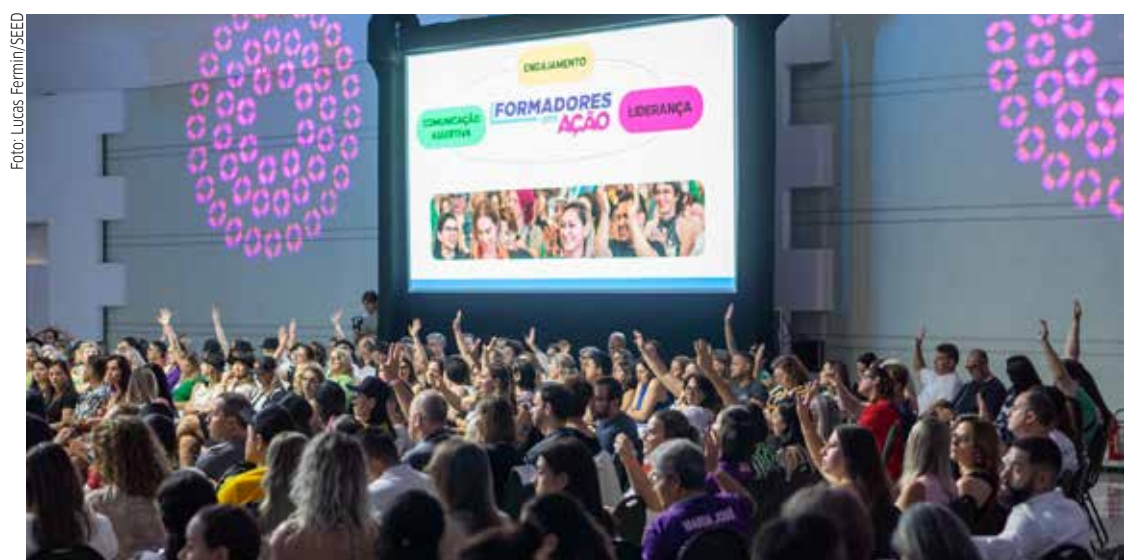
Profissionais da educação recebem capacitação do programa Formadores em Ação

Depois, a Seed ampliou essa oferta para as disciplinas de geografia, história e química,