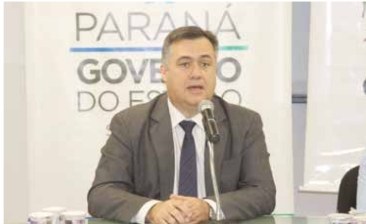
Beto Preto, secretário de Saúde do Paraná

O boletim quinzenal da Dengue divulgado nesta terça-feira (06) pela Secretaria de Saúde do Paraná registra 741 casos confirmados da doença no período epidemiológico. São 163 casos a mais que a publicação anterior.