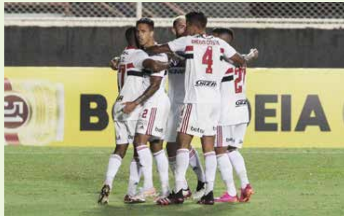
O São Paulo lidera o Grupo E da Libertadores com três pontos e pode aumentar a vantagem na próxima rodada