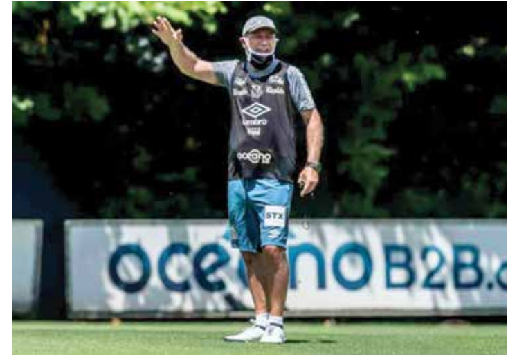
O argentino Ariel Holan teve curta passagem pelo Santos

A passagem de Holan pelo Santos foi encerrada com 12 jogos: quatro vitórias, três empates e cinco derrotas, um aproveitamento de 41,6%, o terceiro pior entre todos os treinadores que dirigiram a equipe neste século. Os números negativos só não superaram os registrados nos trabalhos de Nelsinho Baptista, em 2005, com 30,7% de aproveitamento, e de Cuca, em 2008, 25,4%.