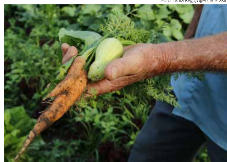
Agricultura familiar recebe recursos do Governo Federal

mento da pandemia da covid-19. O PAA, criado em 2003, compra alimentos produzidos pela agricultura familiar local, com dispensa de licitação, e os destina às pessoas em situação de insegurança alimentar e nutricional e às que-las atendidas pela rede socioassistencial, pelos equipamentos públicos de segurança alimentar e nutricional e pela rede pública e filantrópica de ensino.