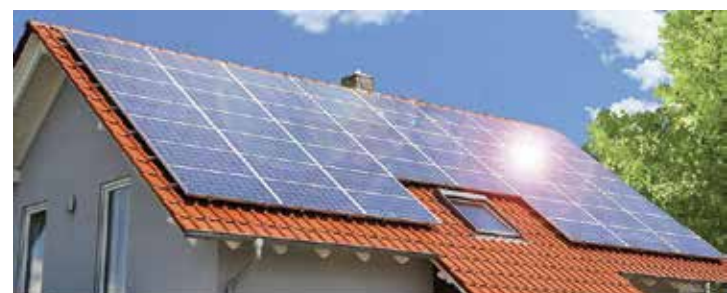
Números mostram aumento no número de placas instaladas em pequenos telhados

Os mais de 300 mil sistemas conectados à rede proporcionam economia financeira e sustentabilidade ambiental a 374,4 mil unidades consumidoras. Agora, a tecnolo-